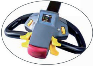
Ergonomik kumanda kolu