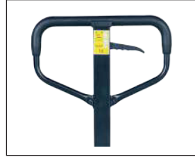
Ergonomik kumanda kolu