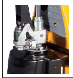
Elektrikli indirme ve kaldırma