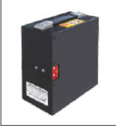
Lityum iyon akü